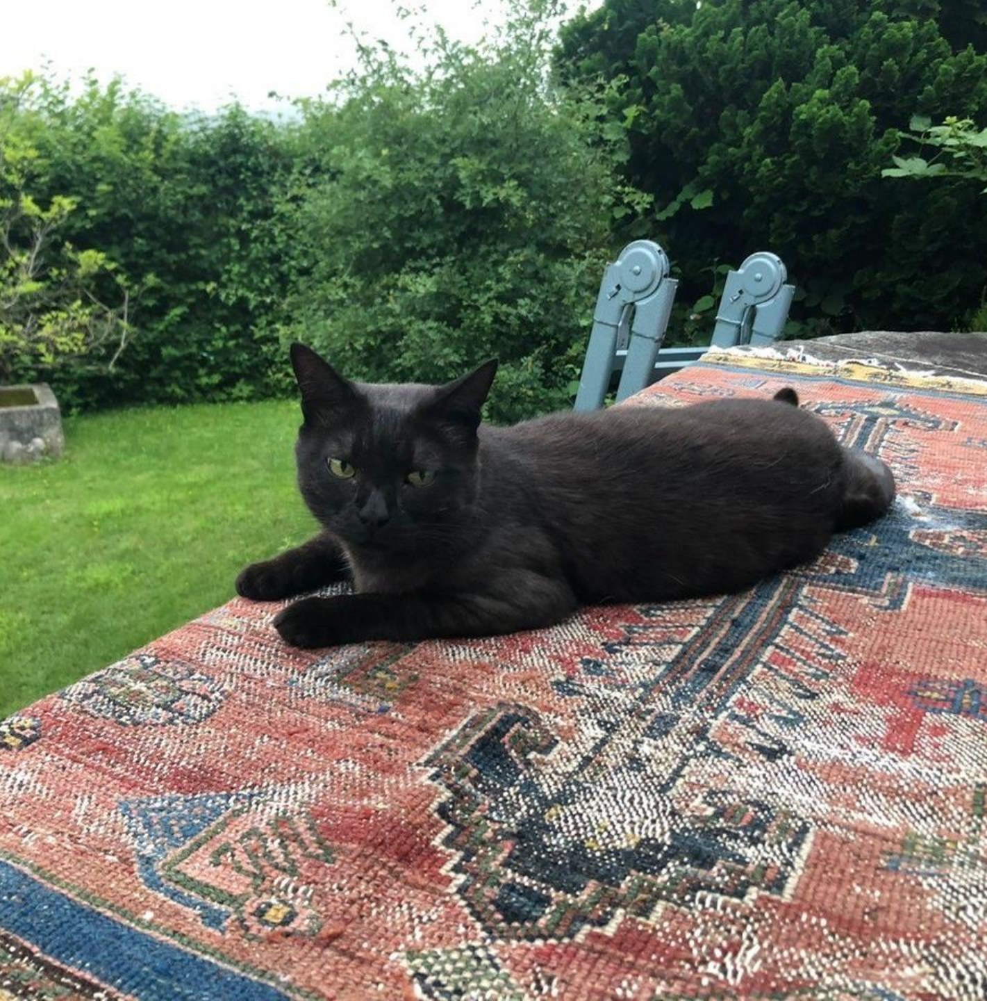
Katze auf Teppich (ohne Stuhl)