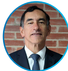
Juan Pablo Cárdenas Árbitro internacional Colombia