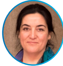
Mercedes Tarrazón Dispute Management España